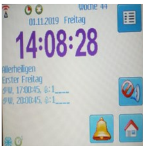
Bedienoberfläche der neuen Uhr

Alle beteiligten Parteien sehen diese Vereinbarung als sehr gelungen an.