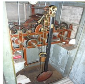
Innenleben der mechanischen Wörz Uhr